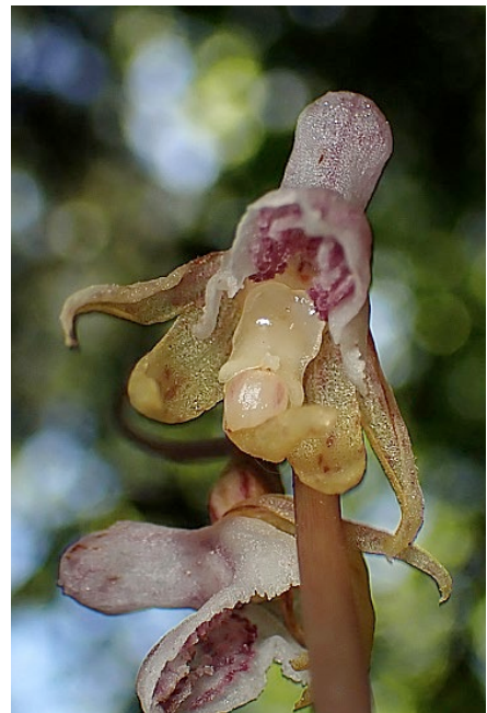
Orchis langei , Platanthera algeriensis i Epipogium aphyllum f. Jordi Vila

De camí a Pont de Suert, vam parar a una àrea de pícnic a tocar de l'embassament d'Escales que coneixia jo mateix, allà hi vam trobar: