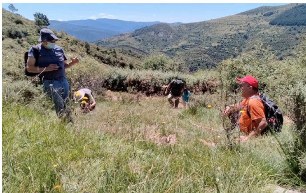
Enfilant-se per mulladius, a la Vall Fosca f Jordi Vila